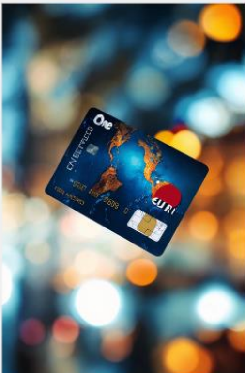
Image de la carte de credit permettant d'échanger la monnaie