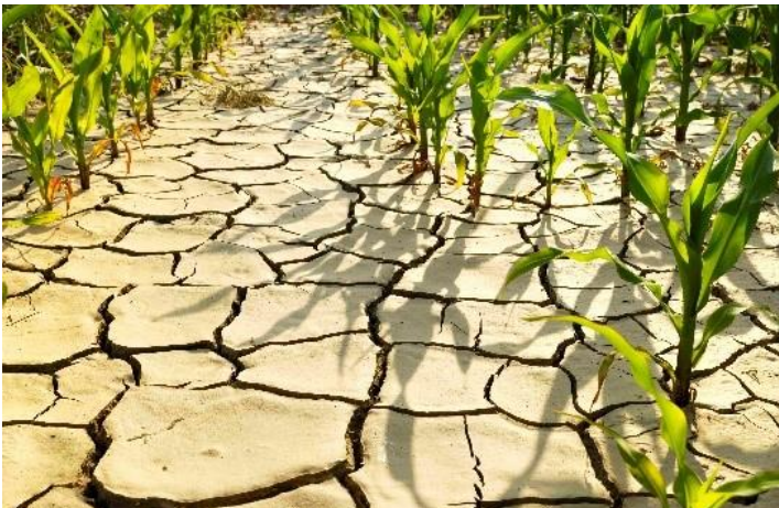
La poudre pourra même faire pousser vos plantations sur les terres sèches comme sur l'image

La poudre Einsteinpousse représentent donc un énorme espoir pour la population.