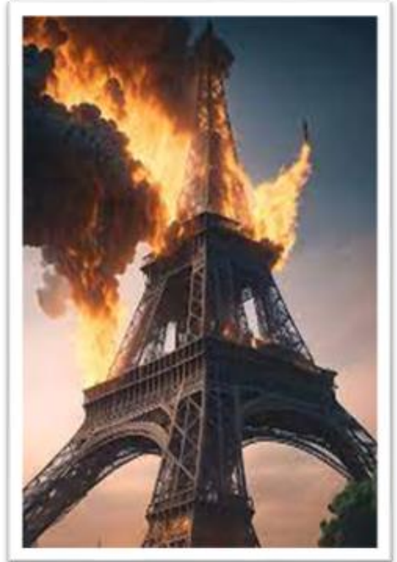
Photo de la Tour Eiffel en feu, pris ce matin

Le président de la République Française a répondu ce matin : « C'EST UN DRAME, NOTRE IDENTITE EST DETRUITE »