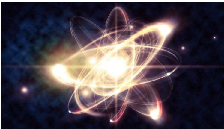
Image potentielle d'antimatière