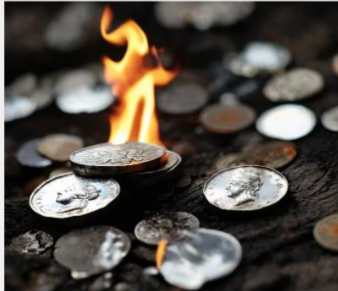
Photographie de pièces brûlées

Depuis des décennies les politiciens débattaient de la nécessité d'une monnaie commune pour faciliter les échanges internationaux et stabiliser l'économie mondiale. L'initiative a finalement vu le jour avec la création du "Credit", une monnaie entièrement numérique destinée à remplacer toutes les monnaies nationales existantes.