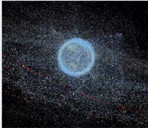
Déchets et satellite en orbite et en dehors de l'orbite terrestre

Depuis maintenant 6 heures, les prédictions de Donald J Kessler se concrétises. D'ici 2-3 heures nous perdrons l'entièreté de notre confort technologique. D'ici 2-3 heures nous ne pourons plus communiquer avec nos proches via téléphone, tablette, ordinateurs, jeux vidéos ... Nous ferons un bon de 128 ans dans le passé. L'Homme va devoir se réhabituer à vivre en communiquant, en s'informant autrement. Nous tous nous remettre à acheter notre bon vieux journal papier.