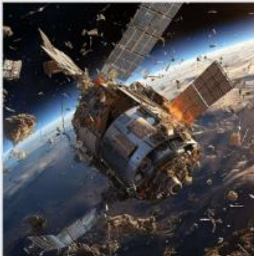
Débris du satellite A 3742666 détruit, image prise par le satellite Z 85245.

"Le principe en est simple : plus il y a de débris en orbite, plus ils vont heurter des objets ou d'autres débris provoquant une réaction en chaine qui augmentera le nombre de débris de façon exponentielle. A terme, l'exploration spatiale et le lancement de satellite seraient impossible." Voilà ce qu'a dit Sacha Rey et qui a été repris et répétés les scientifiques des agences spatiale du monde. Mais cela n'a pas empêchés les géants de l'exploitation spatiale telle SpaceX de continuer leur activités.